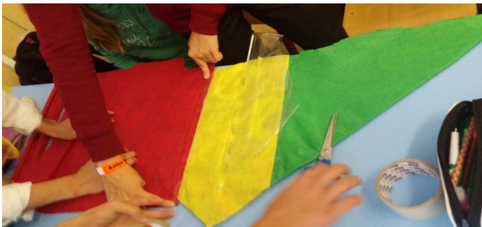
šarkan sa dokončuje

Použitý materiál: kreповý papier, staré noviny, použité desiatové sáčky, drevené paličky, lepidlo, fixky, lepiaca páska, špagát z balíka, ktorý nám zostal.